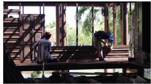
๒๘ กรกฎาคม ๒๕๕๙ แต่งไม้ฝาโดยการขยับและขัด และมีการประชุมของคณะดำเนินงานในช่วงบ่าย