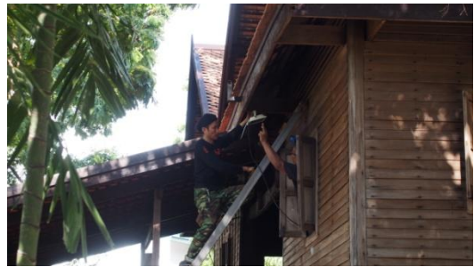
๙ สิงหาคม ๒๕๕๙ ติดตั้งระบบไฟฟ้า อุดรอยรั่วของเสา และช่วงค้ำทดลองความสวยงามของไฟส่องสว่าง