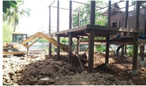
๑๓ มิถุนายน ๒๕๕๙ ติดตั้งผนังและกระดานพื้นเรือนทิศตะวันออก