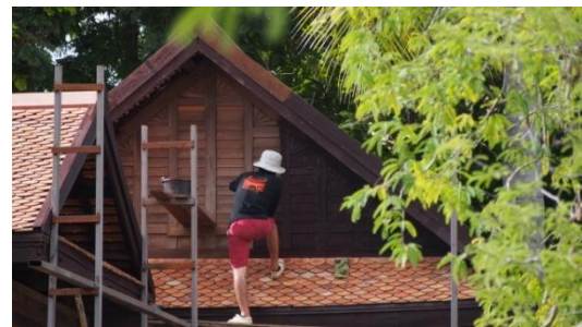
๕ สิงหาคม ๒๕๕๙ ติดตั้งไม้ปิดบริเวณช่องต่อระเบียงกลางเรือน และแต่งพื้นร้านน้ำส่วนต่อจากครัวและทำราวจับ