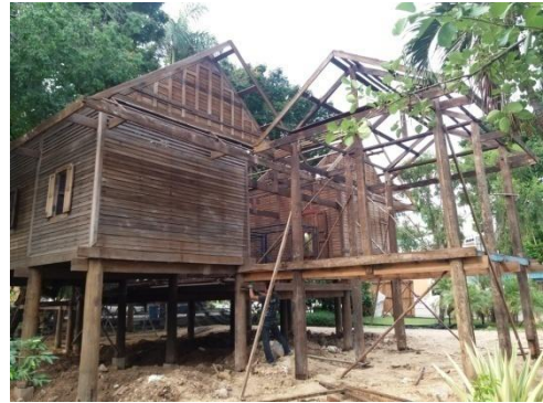
๒๑ มิถุนายน ๒๕๕๙ ติดตั้งระแนงโครงหลังคา