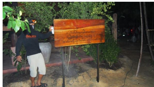
๑๒ สิงหาคม ๒๕๕๙ -พิธีส่งมอบเรือนจากช่างผู้ปรุงเรือนสู่ศิษย์เก่า