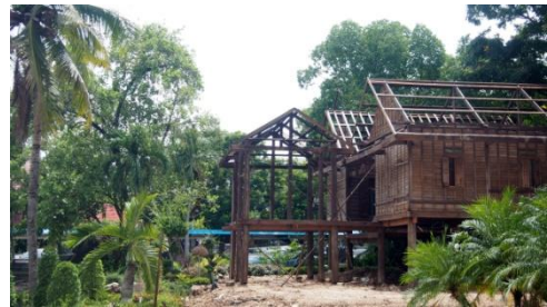
๒๒ มิถุนายน ๒๕๕๙ ติดตั้งไม้ระแนงหลังคา ไม้ตงพื้นครัว และเริ่มส่วนพื้นชานด้านหน้า