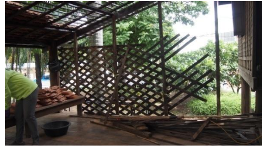
๔ สิงหาคม ๒๕๕๙ ติดตั้งยอดจั่ว ติดตั้งฝาคร่าว อุดรอยรั่วเสา และทาสีบริเวณหน้าจั่ว