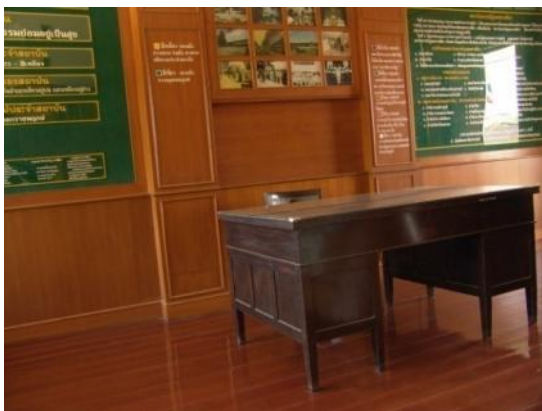
ห้องประวัติมหาวิทยาลัย