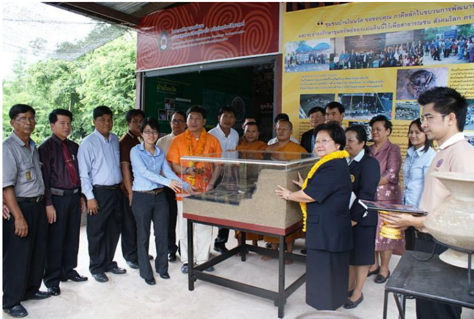
พิธีเปิดและส่งมอบอาคารชั่วคราว ศูนย์การเรียนรู้ท้องถิ่น สมัยก่อนประวัติศาสตร์ แหล่งอารยธรรมบ้านโนนวัต

ผลการวิจัยดังกล่าวได้นำสู่การจัดสร้างอาคารชั่วคราว ศูนย์การเรียนรู้ท้องถิ่น สมัยก่อนประวัติศาสตร์ แหล่งอารยธรรมบ้านโนนวัต จัดแสดงนิทรรศการความรู้ด้านโบราณคดี พร้อมกับ องค์ความรู้เพื่อพัฒนาเป็นหลักสูตรท้องถิ่น ด้วยความร่วมมือแรงรวมใจกันของภาคีพัฒนาและชุมชน บ้านโนนวัต บนพื้นที่ศาลาประชาคม ด้วยความมุ่งหวังที่จะให้เกิดเป็นรูปธรรมของแหล่งเรียนรู้ เพื่อการศึกษาท้องถิ่น พัฒนาสู่การจัดสร้างอาคารถาวรบนพื้นที่ที่ชุมชนจัดเตรียมไว้แล้ว