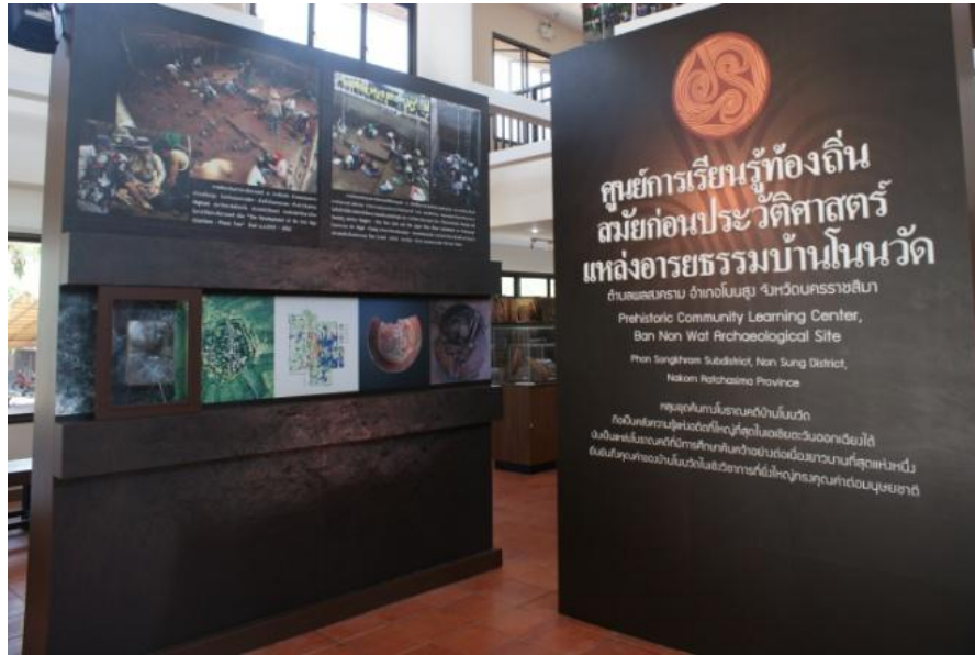
ศูนย์การเรียนรู้ท้องถิ่น สมัยก่อนประวัติศาสตร์ แหล่งโบราณคดีบ้านโนนวัต

หลังจากแรงผลักดันที่ฝ่ายได้กระตุ้นให้ก่อเกิด จังหวัดนครราชสีมา ได้อนุมัติงบประมาณ ในโครงการลงทุนภายใต้ปฏิบัติการไทยเข้มแข็ง ๒๕๕๕ และเริ่มเปิดให้บริการอย่างไม่เป็นทางการ เมื่อเดือนกุมภาพันธ์ พ.ศ.๒๕๕๖