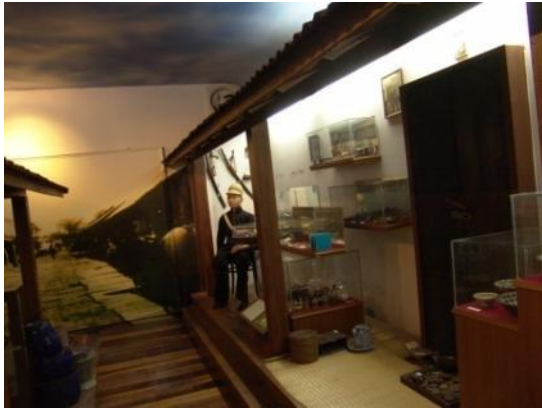
ห้องเมืองโคราช