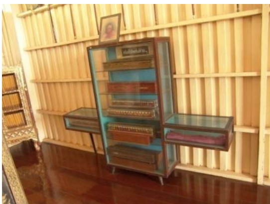
ห้องพุทธศาสตร์