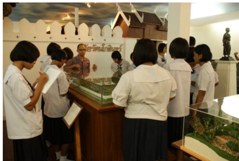
ห้องเมืองโคราช ณ อาคาร ๑ สำนักศิลปะและวัฒนธรรม

นอกจากนี้ยังได้จัดแสดงนิทรรศการด้านศิลปวัฒนธรรมแขนงอื่นๆ ในห้องต่างๆ ได้แก่ ห้องพุทธศาสตร์ ห้องจริยธรรม ห้องดนตรีศิลปกรรม ห้องประวัติสถาบัน บ้านโคราช และพิพิธภัณฑ์เพลงโคราช และบ้านโคราช