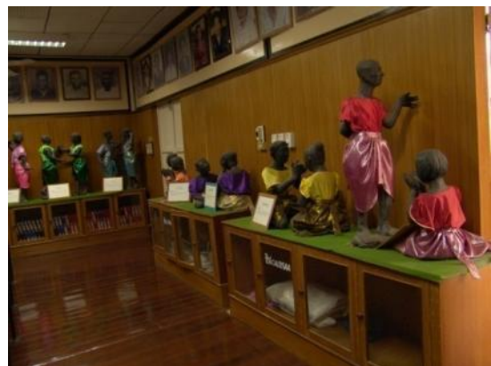
ห้องเพลงโคราช