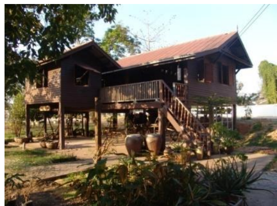
บ้านโคราช