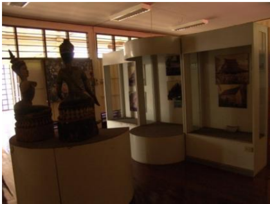
ห้องดนตรีและศิลปกรรม