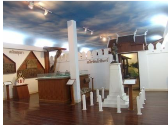
ห้องเมืองโคราช