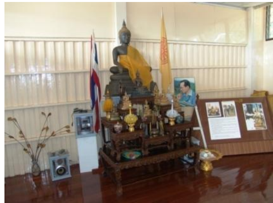
ห้องจริยธรรม