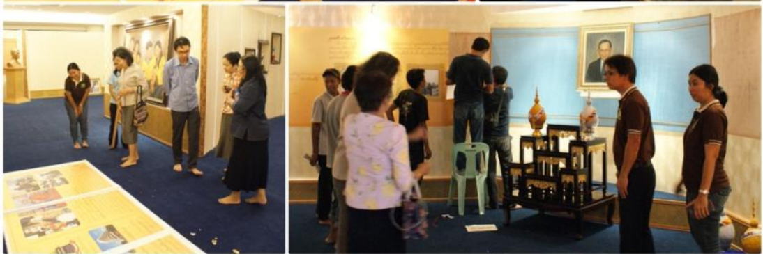
การติดตามการก่อสร้าง