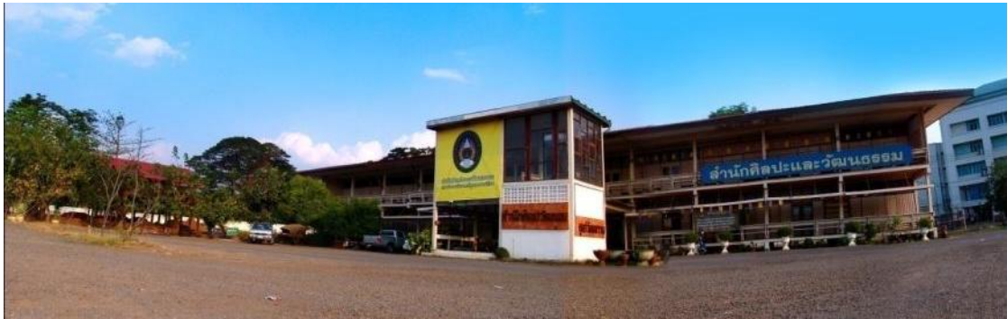
อาคาร ๑ สำนักศิลปะและวัฒนธรรม