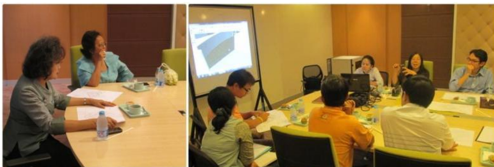
การประชุมติดตามความคืบหน้างานออกแบบ และงานก่อสร้าง