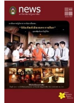
NRRU News ฉบับประจำเดือนมกราคม ๒๕๕๙